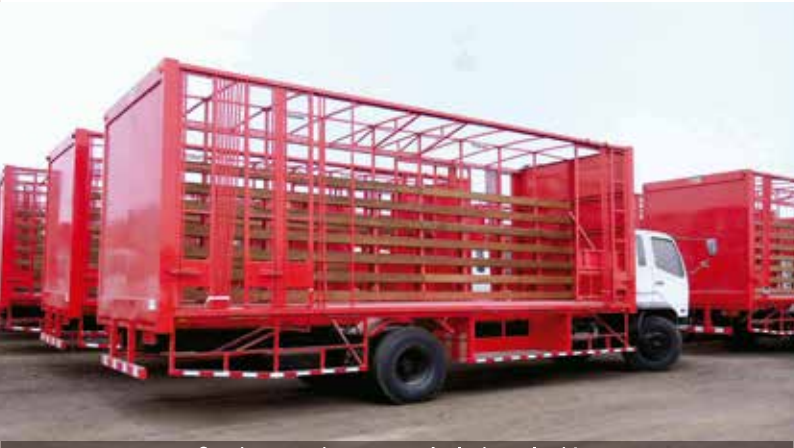
Cortina cautiva antes de la instalación.

Estas cortinas pueden ser en modelo cautiva, flotantes elasticadas o flotantes para driza. Contamos con un stock de accesorios como; rieles de aluminio y acero, rodillos de 2 y 4 ruedas de nylon y acero, hebillas tensoras con cinta de tiro, etc.