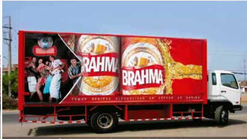
Cortina cautiva después de la instalación.