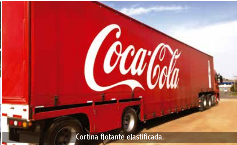
Cortina flotante elasticada.