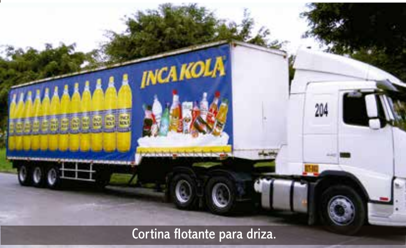
Cortina flotante para driza.