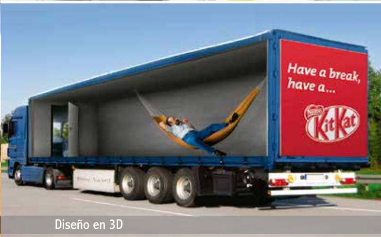
Diseño en 3D